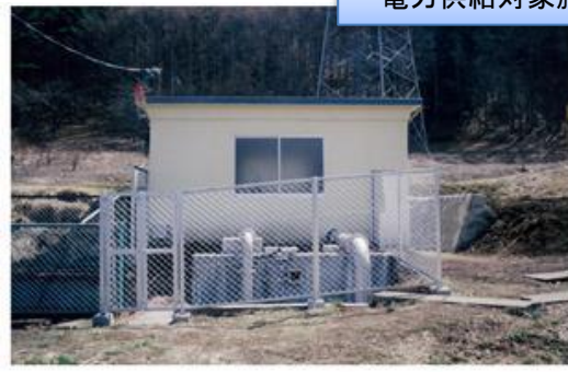
電力供給対象施設(揚水ポンプ施設)

【発電所諸元】 位 置 : 長野県伊那市 最 大 出 力 : 12.2kW 年間発電可能量 : 93Mwh 最大使用水量 : 0.16m 3 /s 有 効 落 差 : 13.1m 運 用 開 始 : H27年9月 造 成 事 業 名 : 地域用水環境整備事業 施 設 管 理 者 : 上伊那美和土地改良区