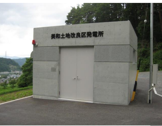
美和土地改良区発電所全景