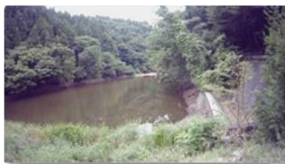
低水位管理されたため池