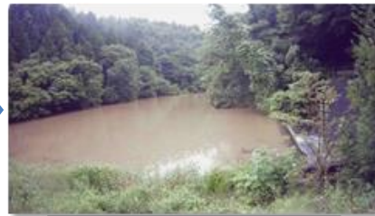
雨水を貯留したため池

写真のように、令和3年度に県内212箇所のため池で低水位管理を実施した結果、約550万m 3 の空き容量(浅川ダム5個分)が確保できました。