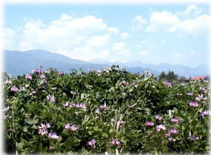
田植え前のレンゲソウと常念岳

農薬や化学肥料に頼らず穀類を栽培しています。肥料という概念はありません。レンゲソウ等草と、稲わら、コヌカ、田畑から取れたものを戻しています。“土の力”、“微生物との共生”、“自らの力”で育った作物です。