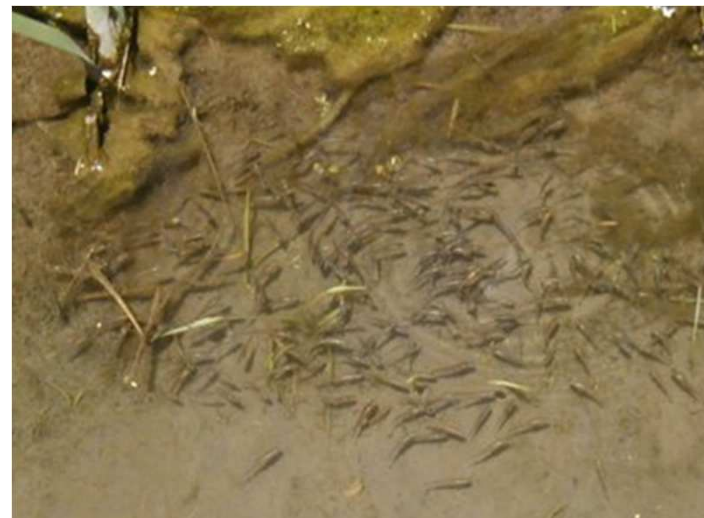
どんぶり（水たまり）に集まるメダカ