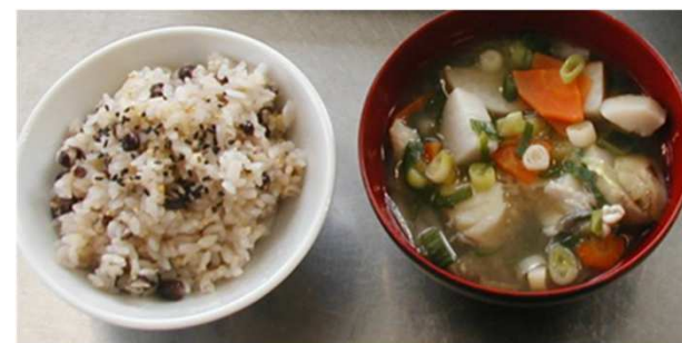
真珠のようなご飯と具たくさん味噌汁

https://www.facebook.com/profile.php?id=100006035147036