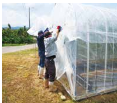
アスパラ小型ハウス被覆実習