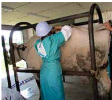
家畜人工授精師講習会