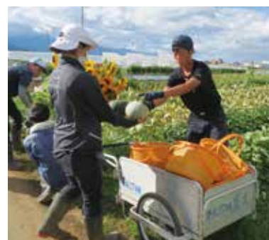
学生園場の収穫実習