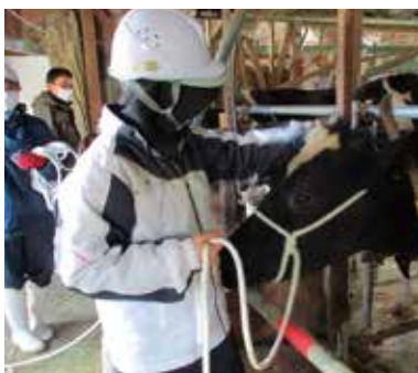
頭絡実習(ロープワーク)