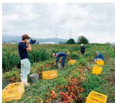
現地実習(加工用トマト収穫)