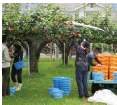
日本なしの収穫実習