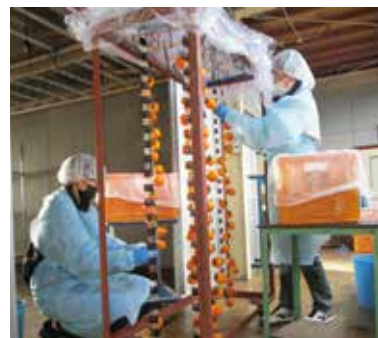
市田柿の加工実習