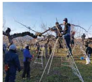
りんごの現地せん定実習