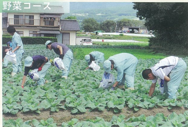
ゼミでは実際の農家を訪れ実習もします