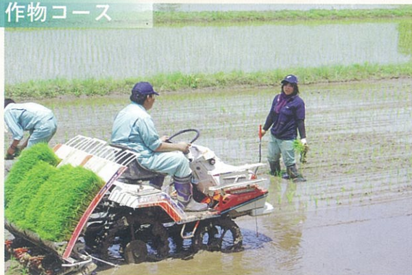
作物コースは田植えからはじまります