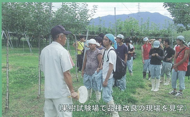
(果樹試験場で品種改良の現場を見学)