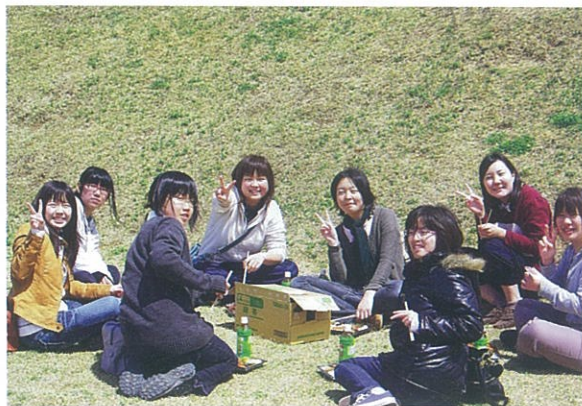
ラリーを終えて松代城二の丸で先輩と昼食