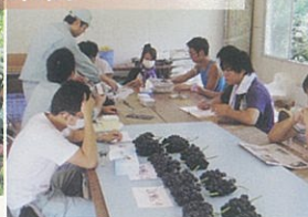
収穫されたブドウの色、糖度等品質を皆でチェックします