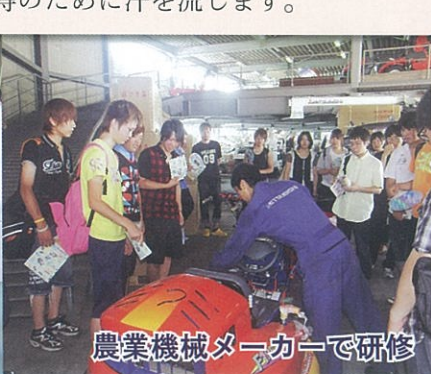
農業機械メーカーで研修