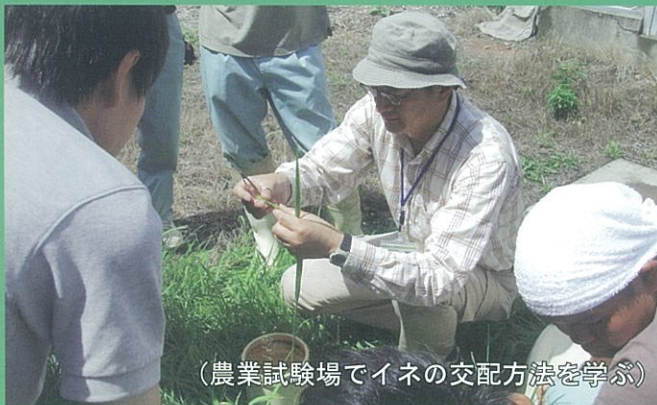
(農業試験場でイネの交配方法を学ぶ)