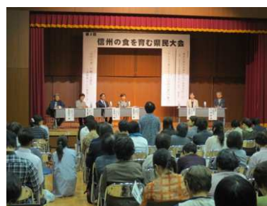
【第2回信州の食を育む県民会議】