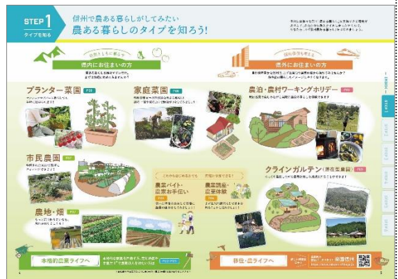
【STEP1 4-5 ページ】