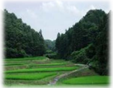
ひたちおおみやし 茨城県常陸大宮市