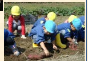
地域の園児による収穫体験