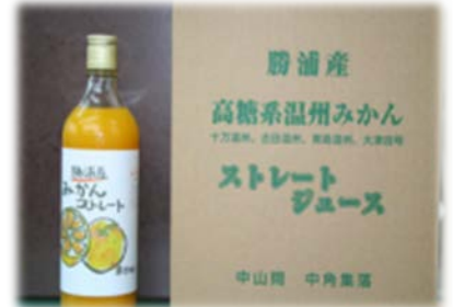
ミカンのジュース加工