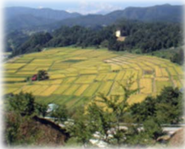
あさひまち 山形県朝日町