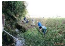
【集落共同の水路清掃】