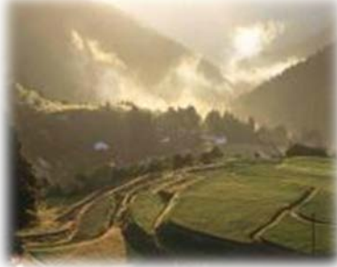
かみかつちょう 徳島県上勝町