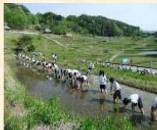
修学旅行生の田植え体験