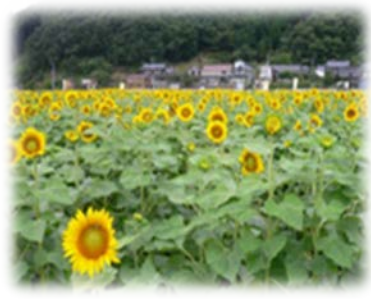
さようちょう 兵庫県佐用町