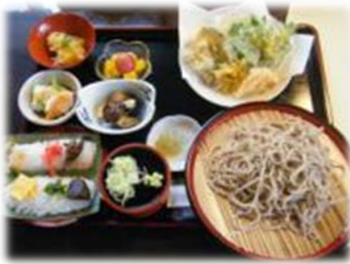
地場農産物を使用した料理

中山間地域では、特色のある様々な農産物やその加工品を生産しています。中山間地域等直接支払は、このような皆さんの地域にある食べ物を販売・製造するための取組にも使われています。