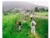
農地法面の草刈り