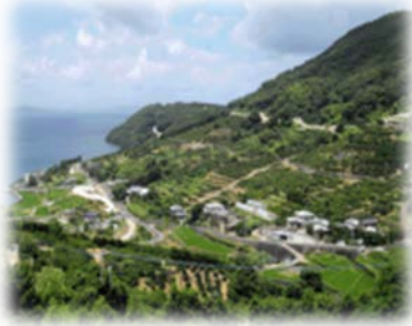
ながよちょう 長崎県長与町

中山間地域には、他では見ることのできない美しい風景や豊かな自然がたくさんあります。中山間地域等直接支払は、このような都市部の人たちにとっても貴重な農村の環境や景観を守るための取組にも使われています。