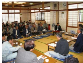
【集落での話し合い】