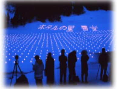
じょうえつし 新潟県上越市