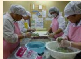
集落住民による「草もち」の製造