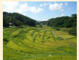
よこね田んぼの秋の様子