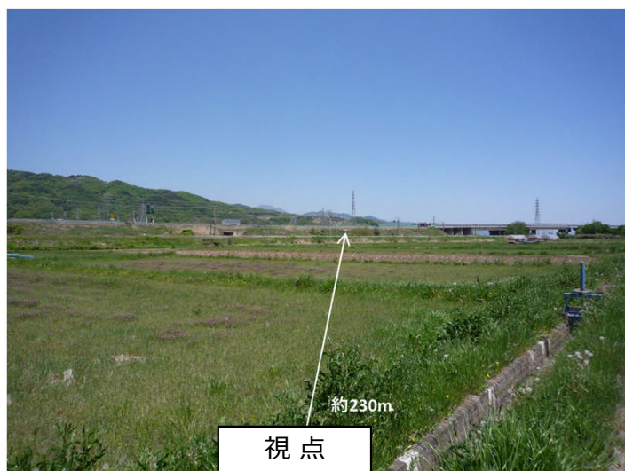
長野自動車道（長野市篠ノ井）