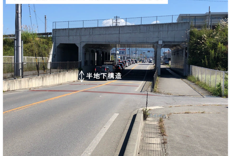
中部横断自動車道