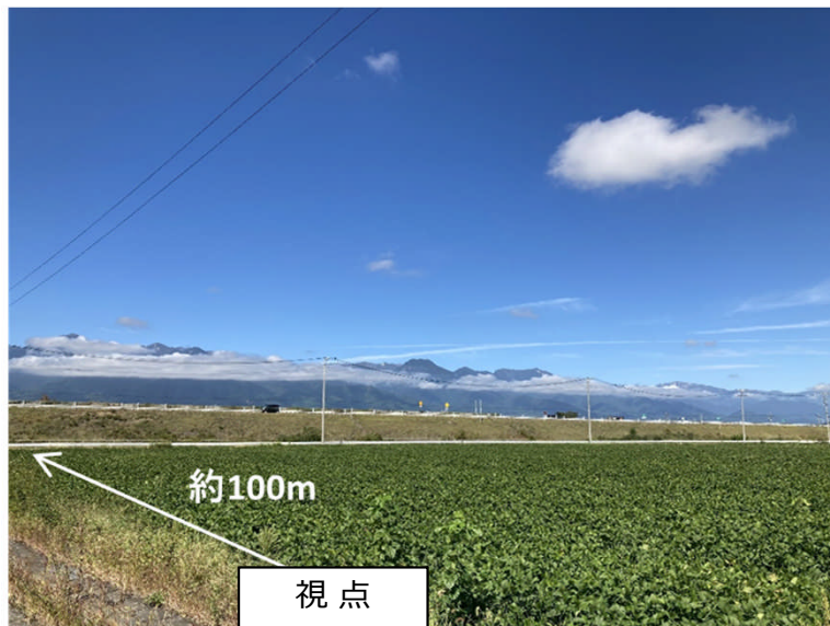
長野自動車道（安曇野市豊科）