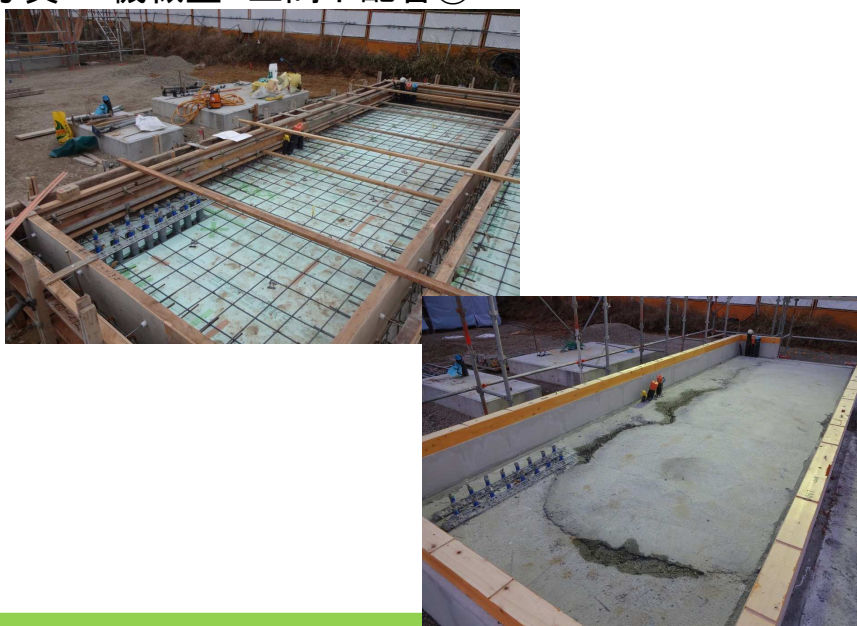
写真 機械室 土間下配管②