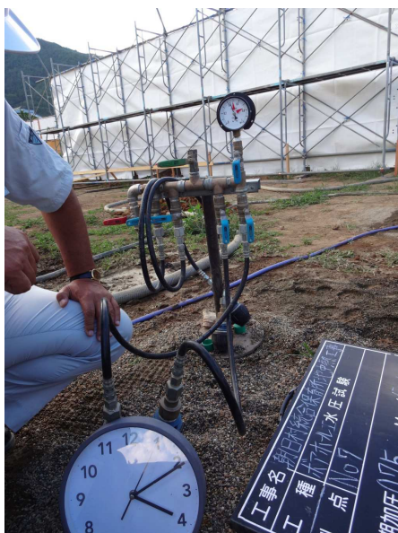
写真 水圧試験、TRT試験