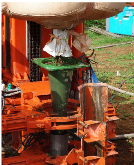
写真 ボアホール工事②