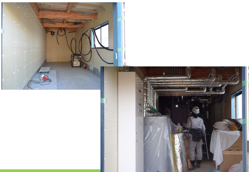
写真 機械室(ヒートポンプユニット等)