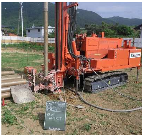
写真 ポアホール工事①