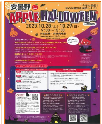
※各画像は参考画像となります