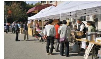
法印さんと新そばまつりの様子