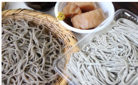
すがかわ新そば（販売もあります）