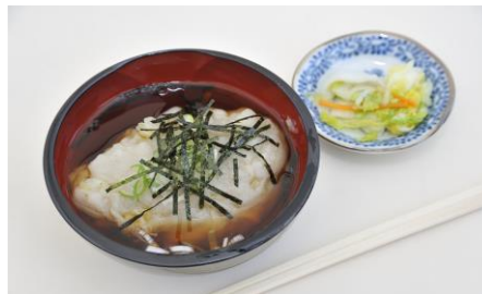
無形文化財「はやそば」