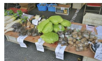
地元新鮮野菜の販売