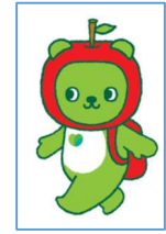
長野県 PR キャラクター「アルクマ」 ©長野県アルクマ

長野県大阪事務所・観光情報センター Report Letter Vol. 40 (2025. 9. 10)