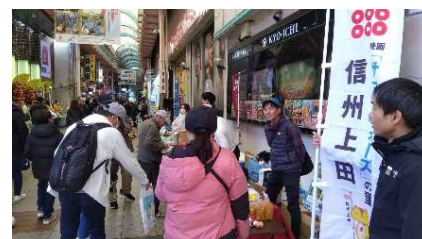
昨年、上田市参加の様子

全国各地のアニメゆかりの地が集合し、各地の魅力を PR。長野県からは千曲市がゆかりアニメ作品「Turkey !」の紹介とともに、聖地巡礼マップや観光パンフレットの配布、ポスター・サイン等の展示、スタンプラリーの P R により千曲市の観光情報を発信。