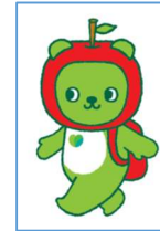
長野県 PR キャラクター「アルクマ」 ©長野県アルクマ

長野県大阪事務所・観光情報センター Report Letter Vol. 43 (2025. 12. 10)