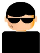
攻撃者 (A社のなりすまし)