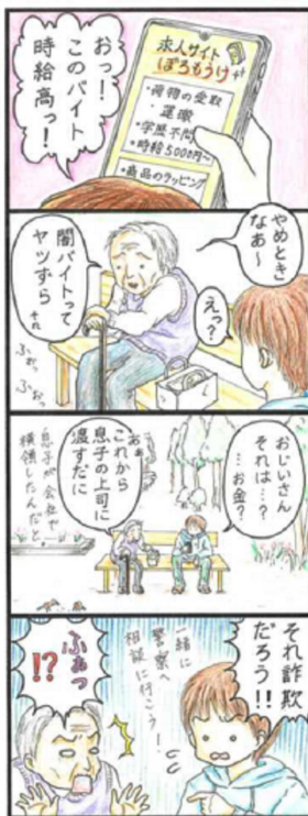
お互いにご用心 ガオチャオ (41歳)