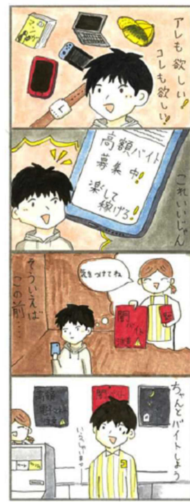
ちゃんどバイトしよう まめまめ (12歳)