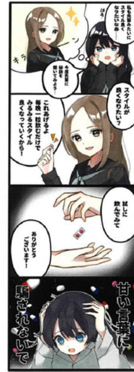
甘い言葉 原 祥希 (17歳)