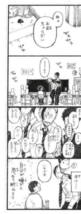
断わりょう おかつば (19歳)