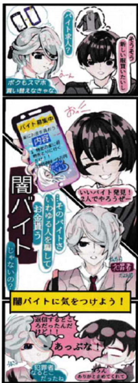
詐欺詐欺加増防止 ■バイトに気をつけよう! 藤とタカ (12歳)