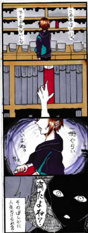
人生かけれる? つちのこ (14歳)