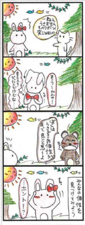
みんなの個性 井口 芽生 (11歳)