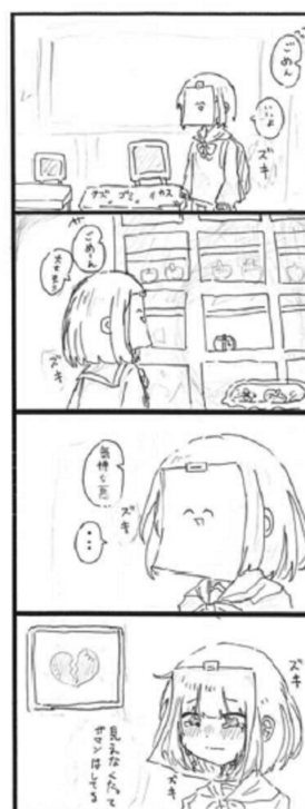
心のキズ (はなさず) (11歳)