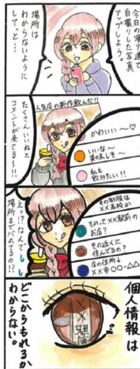
SNS利用に係る非行及び被害防止 アルバカ 25歳