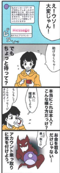
お金を取るだけじゃない 両角ひかり (17歳)