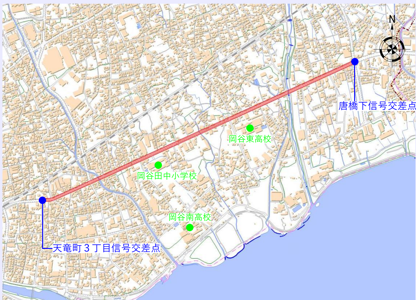
自転車関連事故発生状況（岡谷署管内・R3～R7年中）