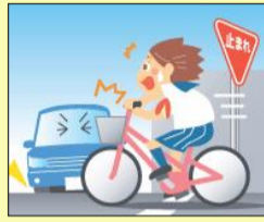
指定場所一時不停止