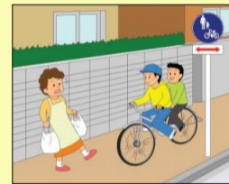
歩道通行時の 通行方法違反