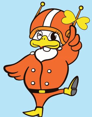
長野県警察 シンボルマスコット 「ライピちゃん」