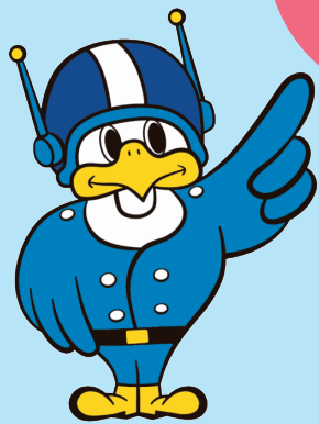
長野県警察 シンボルマスコット 「ライポくん」