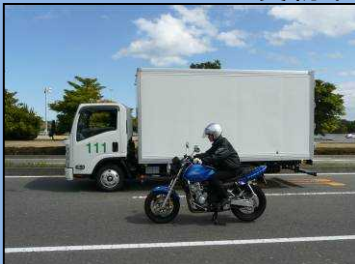
しかく じどうにりんしゃ サイドミラーの死角にいる 自動二輪車