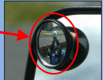
ほじょ しかく じどうにりんしゃ しかく 補助ミラーでは死角にいる 自動二輪車を確認できる。