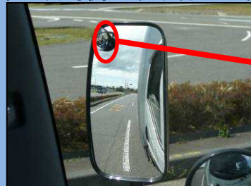
じどうにりんしゃ しかく サイドミラーでは自動二輪車 を確認できない。