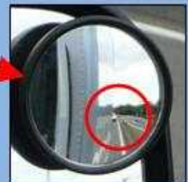
補助ミラーでは真後ろの 緊急車両を確認できる。