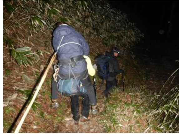
Bさんを背負って搬送

登山道に戻ってからは、後は横尾に向けて下山するだけでしたが、ここに来て長時間行動の影響かBさんのペースが急激に低下し、最終的には介助無しでは立つことも困難になってしまいました。Bさんによると「前日はよく眠れず、睡眠時間は1時間程度だった」ようです。途中から救助隊員がBさんを背負って搬送し、日付の変わった午前1時8分に横尾に到着し、救助を完了しました。