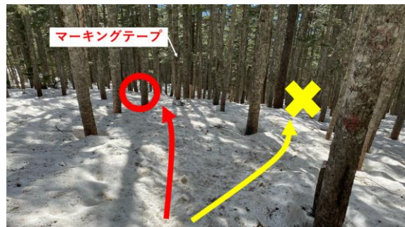
確認された二つのトレース