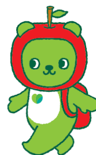
長野県 PR キャラクター 「アルクマ」 ©長野県アルクマ