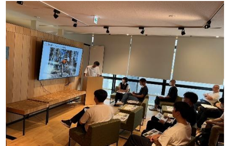
令和5年度就林セミナーの様子