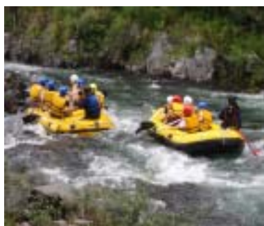
木曽川でのラフテング

・開田高原は標高1000m～1200mの高冷地のためソバ、スイートコーン、その他高原野菜の栽培が盛んであり、これらの食材を利用した蕎麦店、レストラン、食品販売店が各地に展開し観光客の人気を頂いております、特に地元産のキノコや山菜を使った料理、この地方独特のスッキ漬や朴葉巻きなどの食材は訪れる方に人気があります。