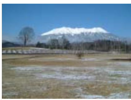
木曽の象徴御嶽山の雄姿