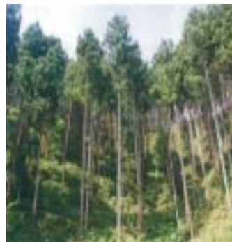
水無神社のみこしまくり 森林整備ボランティア よく整備されている森林