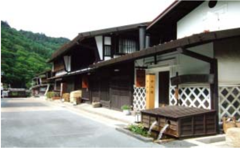
旧中山道の面影を残す町並み