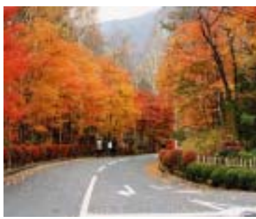
木曾駒高原の紅葉