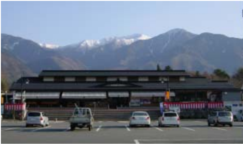
道の駅 日義木曾高原ささりんどう館より木曾駒ヶ岳を望む