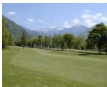
木曾駒高原内のゴルフ場