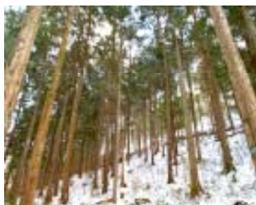
良く整備された森林