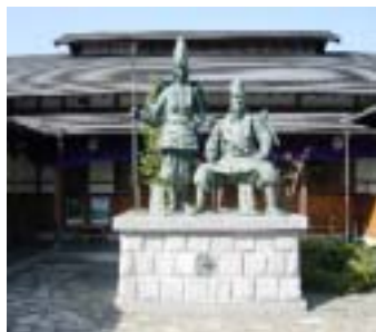
木曾義仲と巴御前の像