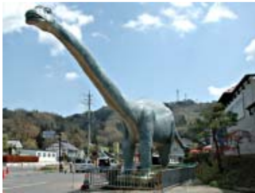
信州新町化石博物館前

信州新町地域は、綿羊の産地としても知られ、現在は肉羊種の「サフォーク」の飼育に力を入れています。古くからジンギスカン料理が名物として定着しており、観光客の方々にも人気があります。