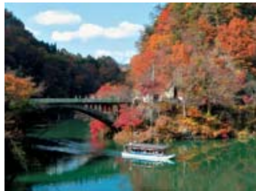
紅葉の久米路峡と屋形船