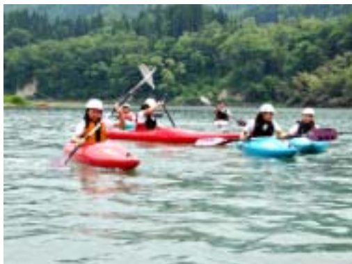
悠々と流れる犀川でカヌー体験

そして、羊の産地でもある信州新町の ジンギスカン料理 は、是非味わっていただきたい名物グルメの一つです。