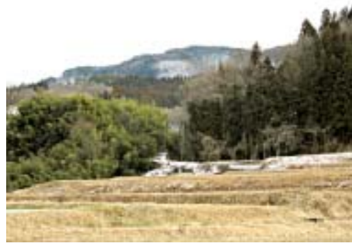
杉林と緩衝帯(左の竹やぶと杉林の手前)

金銭的なご支援によって、整備の委託費用や燃料代などに当て、緩衝帯整備を進めます。