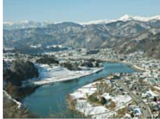
信州新町地域と犀川 冬の風景

標高は約420m～1,160mと高低差があり、地勢は起伏に富んだ山間急傾斜地帯です。気象は夏に涼しく、冬は冷え込む気候です。