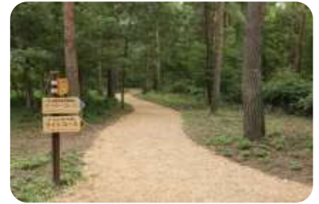
ウッドチップの小径 足や腰に負担の少なく、心地よい