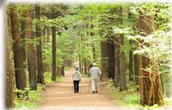
フラットなコースで森林浴が楽しめます