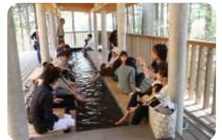
足湯 (大芝高原味工房に併設)