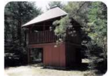
林望台 ちょっと上から木を観察