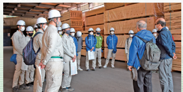
先輩の職場におうかがいします