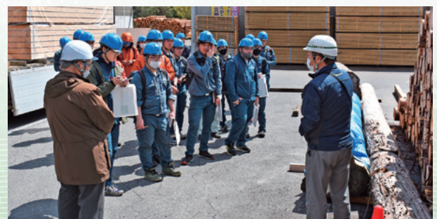
先輩の職場におうかがいします