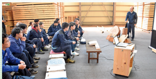
業界の方から林業の現状を学ぶ