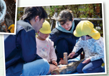
木曾こども園との交流