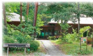
長野県林業総合センター