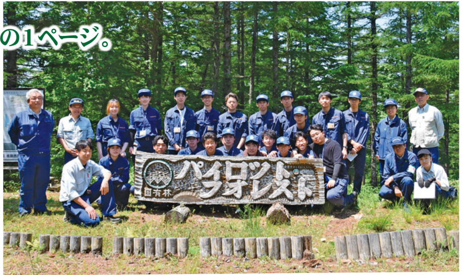
2年生 国内研修(北海道:パイロットフォレスト)