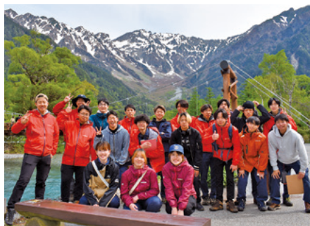
2年生 山の環境学(上高地)