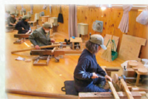
長野県上松技術専門学校