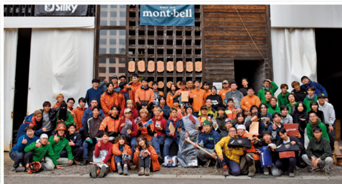
三林大対抗伐木選手権大会