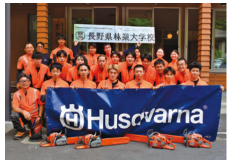
ハスクバーナトップガン研修