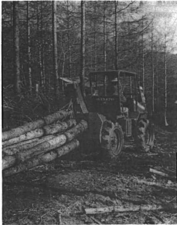
〈林内作業車による間伐材の搬出〉