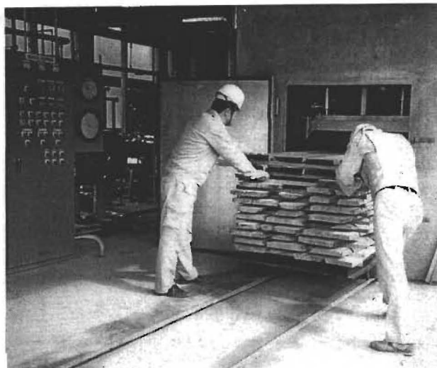
写真 - 3 蒸気式乾燥装置 (木材乾燥試験用)

それには、木材とプラスチックの複合化（WPC）により強度を高め耐摩耗性を向上させたり、木材の細胞中にセラミックを形成（無機質複合化）し、あるいは、難燃剤を注入すること