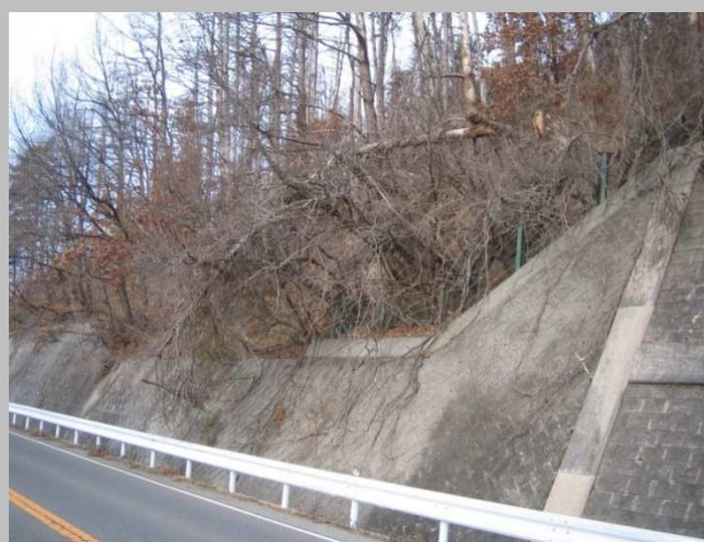
道路沿いの林地で松枯れが拡大しており、強風時や大雨時に国道への倒木が頻繁に発生する。