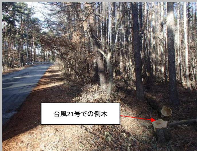
現場では既に倒木が発生しており、倒木のおそれがある立木が残存していることから、これらの危険木の除去を行う