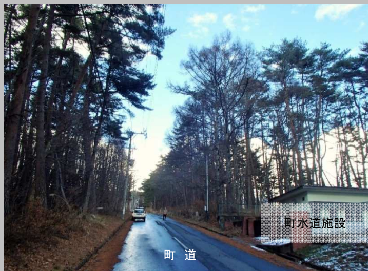
町道沿いに電線が敷設され、倒木により道路の通行、停電及び水道施設に影響を与える危険性が高い