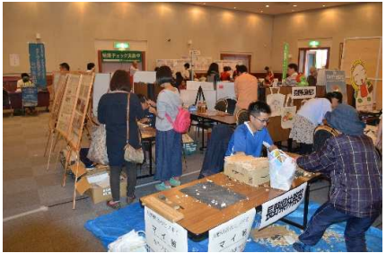
10月1日(日)協同組合フェスティバル(安曇野市)

リーフレットを作成し、県植樹祭や「信州 山の日フェスタ」等で配布し、森林税のPRを行いました。