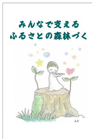
体験型森林づくりワークショップ