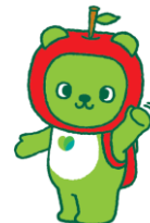
長野県PRキャラクター『アルクマ』 ©長野県アルクマ