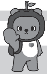
長野県PRキャラクター 「アルクマ」 ©長野県アルクマ

令和7年6月11日に、カスタマーハラスメント対策の強化等を盛り込んだ改正労働施策総合推進法が公布されました。