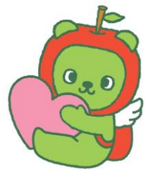
長野県PRキャラクター『アルル』 ©長野県アルル

【労働に関する相談】 相談専用電話 0268-23-1629（土・日・祝日除く）8:30～17:15