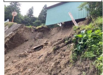
被害状況(建物一部破損)