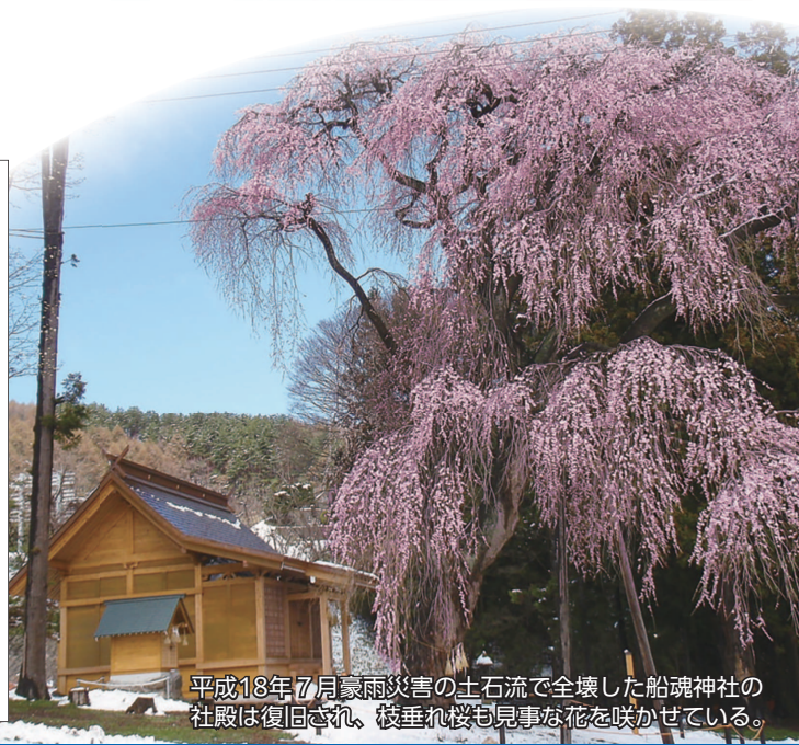
平成18年7月豪雨災害の土石流で全壊した船魂神社の社殿は復旧され、枝垂れ桜も見事な花を咲かせている。

本シンポジウムは、平成18年7月豪雨災害から20年を迎える節目に、当時の経験と教訓に加えて本地域に伝わる災害の記録をあらためて振り返るとともに、次世代へどのように伝えていくべきかを考えるものです。諏訪6市町村それぞれの記録を共有し、将来に向けた持続的な安全・安心の備えを地域全体で考える場とします。