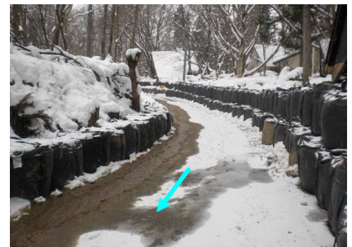
沢水进行处理するための仮排水路 R6.1完成