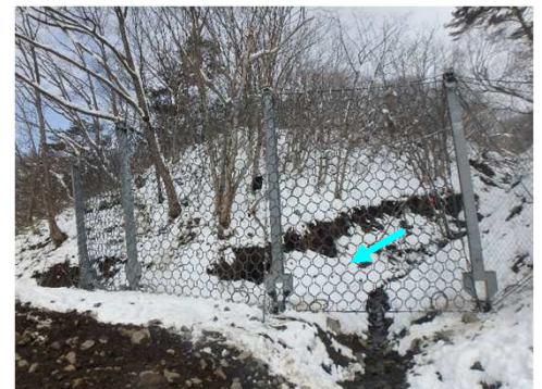
二次災害防止のためのアンカーネット式構造物 R6.3完成