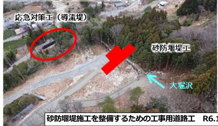
砂防堰堤施工を整備するための工事用道路工 R6.1完成