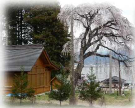
船魂社のシダレザクラ（岡谷市）