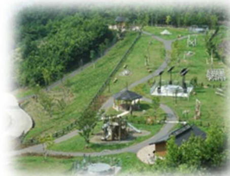
防災メモリアル地附山公園（長野市）