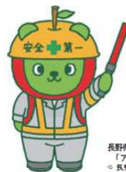
長野県PRキャラクター「アルクマ」 © 長野県アルクマ