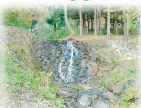
荻沢川石堰堤（千曲市）