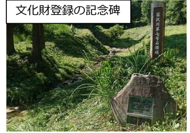
文化財登録の記念碑

荇沢川石堰堤は、平成21年に国の登録文化財に登録され、地元区の皆様による草刈などの環境整備が行われています。