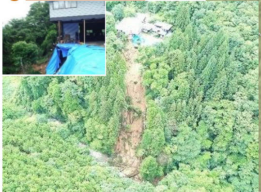
【被害状況等】住家敷地一部崩落、1世帯避難