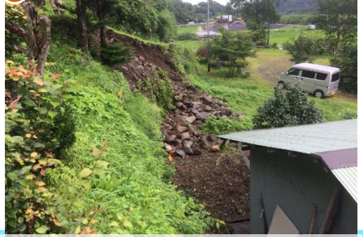
【被害状況等】石積み崩落