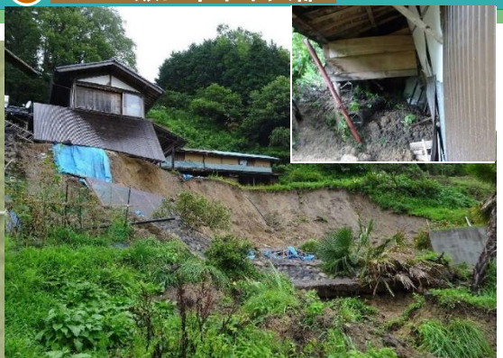
【被害状況等】人家1戸一部損壊、3世帯自主避難