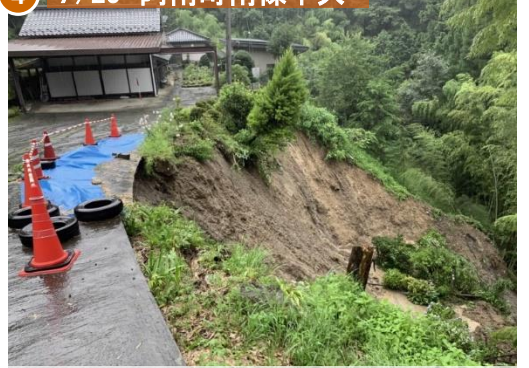
【被害状況等】1世帯自主避難