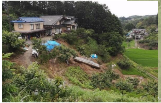
【被害状況等】人的被害なし、駐車場等被災