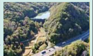
むらさわ ④室沢砂防堰堤