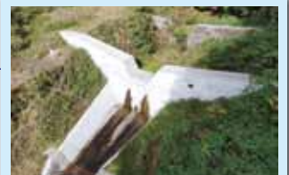
いわい どうさわ ①岩井堂沢砂防堰堤