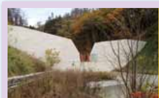
こならさわ ③小橋沢砂防堰堤