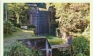
ぬのみや ②布宮砂防堰堤