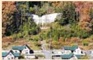
ひきざわ ⑤日岐沢砂防堰堤