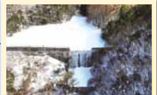
ながい ⑥永井砂防堰堤