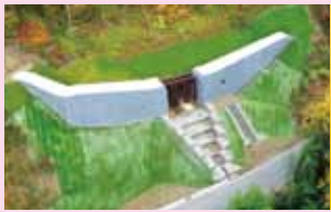
きた ゆざわ ⑦北湯沢砂防堰堤