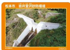
松本市 岩井堂沢砂防堰堤