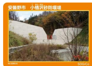
安曇野市 小樽沢砂防堰堤