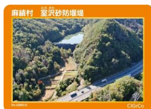
麻績村 室沢砂防堰堤