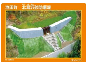
池田町 北湯沢砂防堰堤