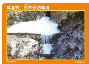
筑北村 永井砂防堰堤