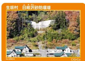
生坂村 日岐沢砂防堰堤