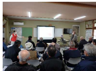
《赤牛先生による防災教育》