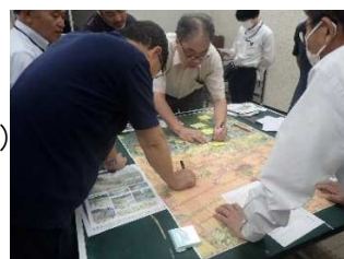
《地区防災マップ 住民懇談会》