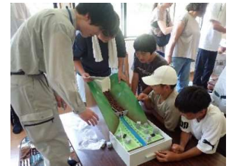
《小学生の防災学習》