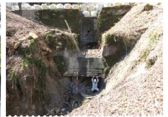
《砂防メンテナンス事業 安曇野市 明場沢》