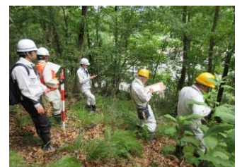
《土砂災害危険箇所パトロール》