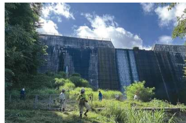
《ボランティアによる維持管理》