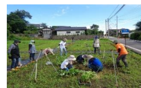
【地域ぐるみの共同活動】