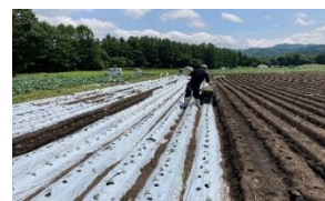
【堆肥入り化学肥料現地試験】