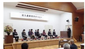
【佐久農業青年のつどい】