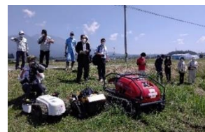
【ラジコン式草刈機実演会】