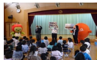
【保育園における食育活動】