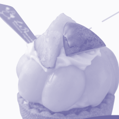
お菓子工房 ル・ポミエ