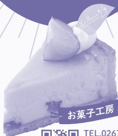
お菓子工房 ル・ポミエ