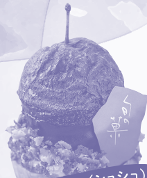
Chou Chou (シュシュ)