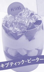
ケーキブティック・ピーターズ