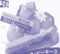
ケーキブティック・ピーターズ