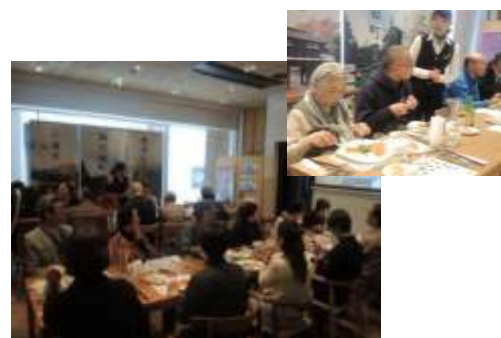
【銀座 NAGANO イベント】