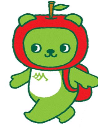
長野県観光PRキャラクター「アルクマ」